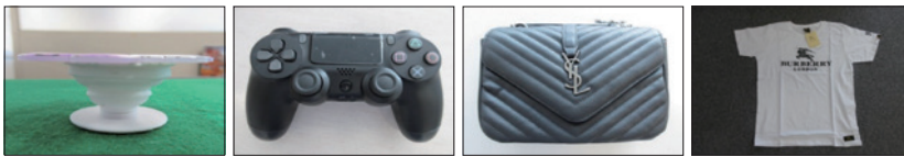
スマートフォン等の グリップ・スタンド(特許権)